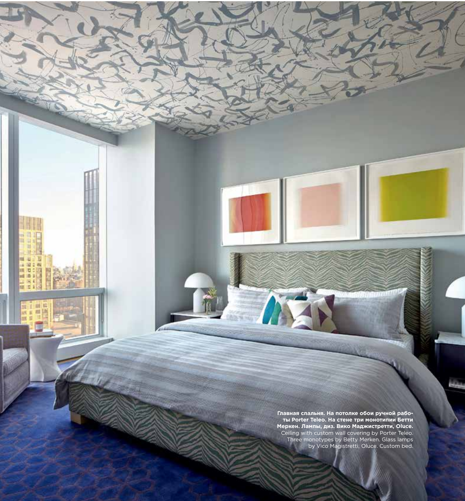
Главная спальня. На потолке обои ручной работы Porter Teleo. На стене три монотипии Бетти Меркен. Лампы, диз. Вико Маджистретти, Oluce. Ceiling with custom wall covering by Porter Teleo. Three monotypes by Betty Merken. Glass lamps by Vico Magistretti, Oluce. Custom bed.

“ Уникальный, неповторимый интерьер — вот главная тенденция. A unique and unrepeatable interior is the main tendency. ”